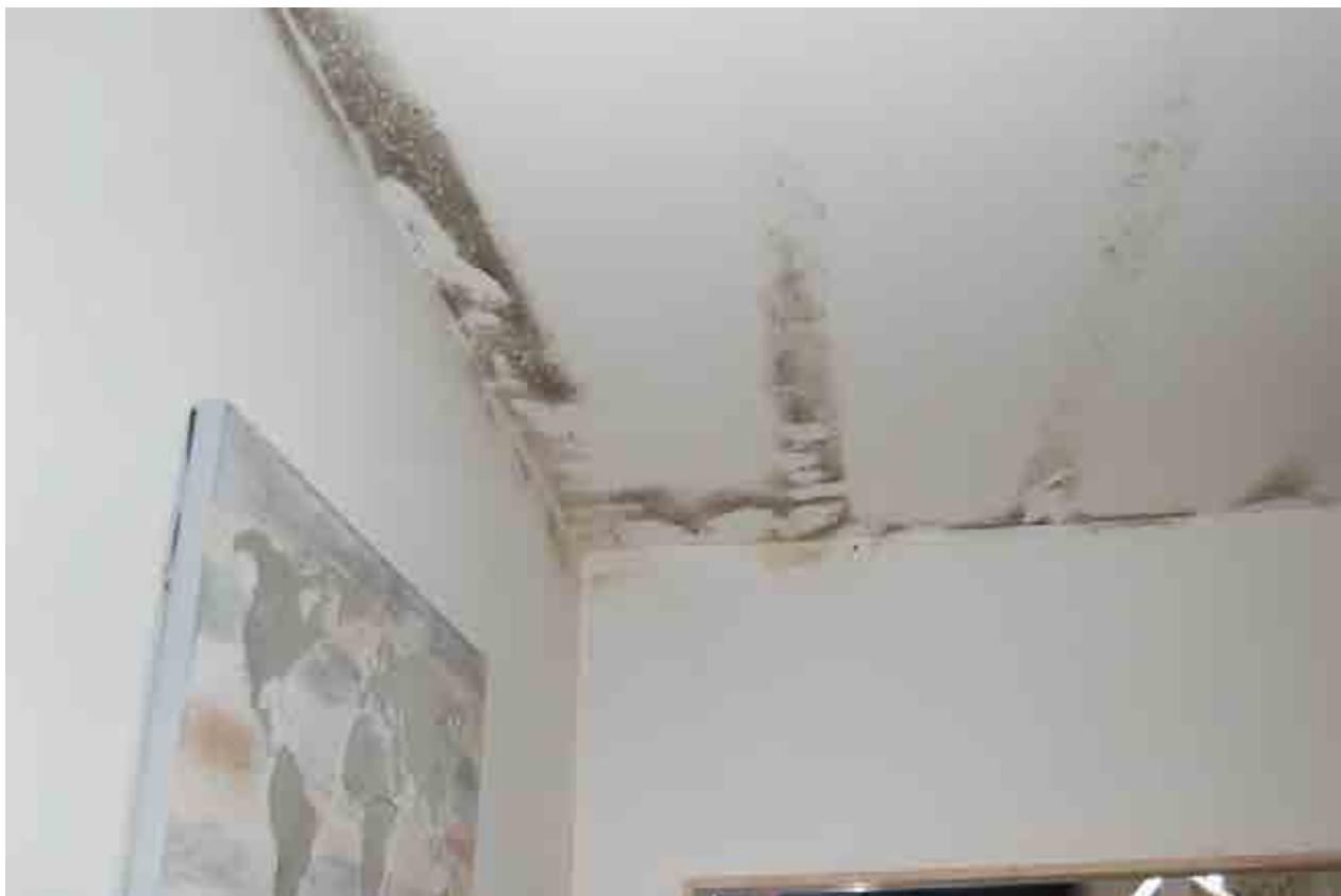
Foto 78 - Dettaglio solaio salotto