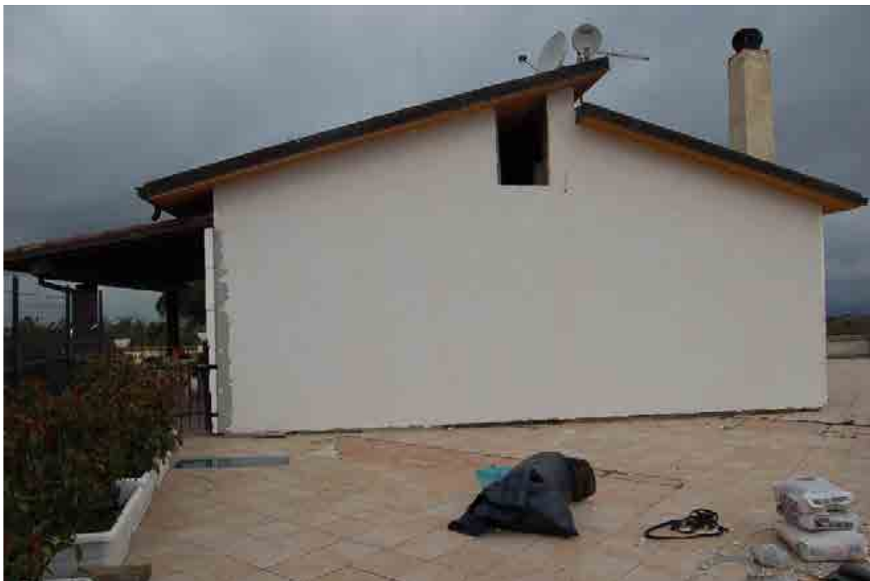
Foto 74 - Fabbricato isolato fronte est