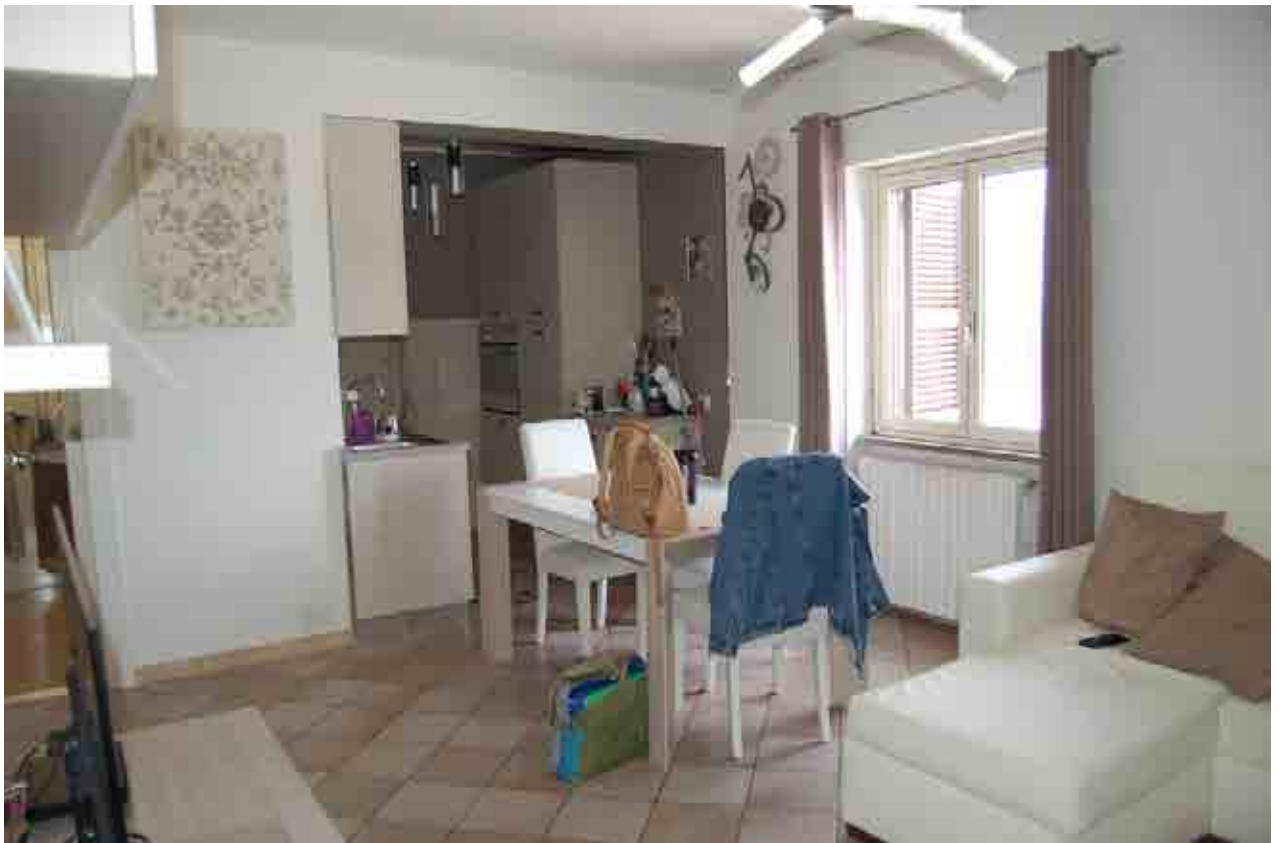
Foto 76 - Salotto - soggiorno