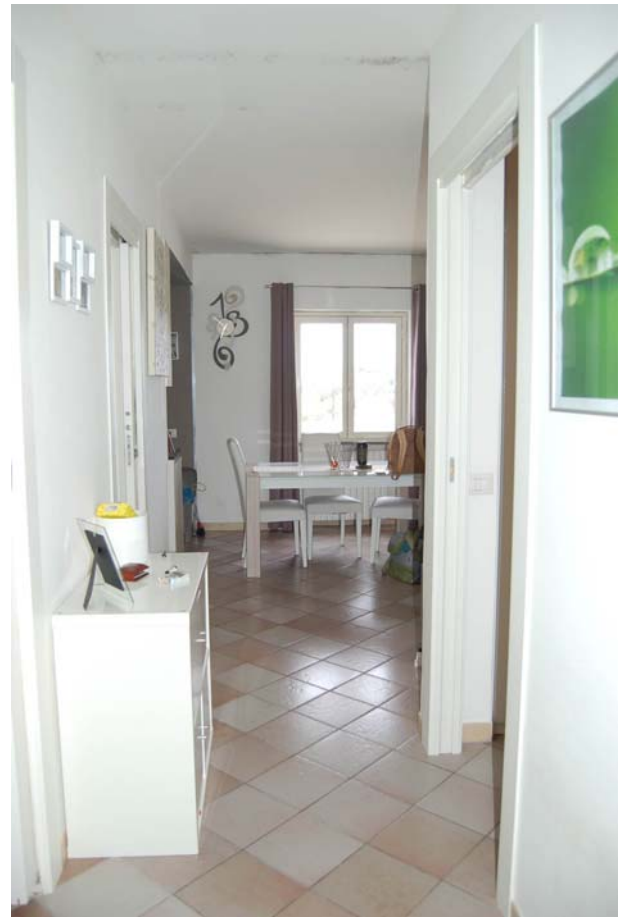
Foto 75 - Ingresso