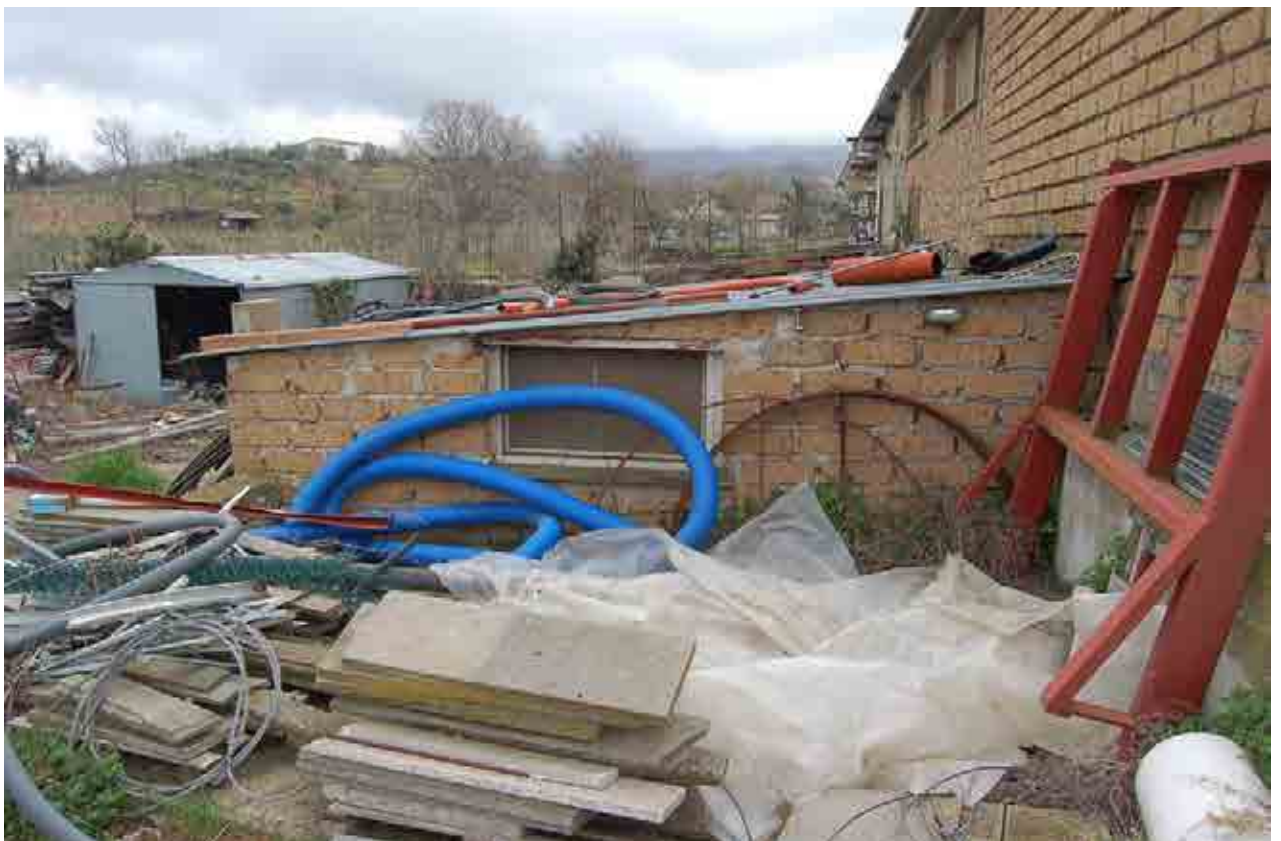
Foto 94 - Porcilaia