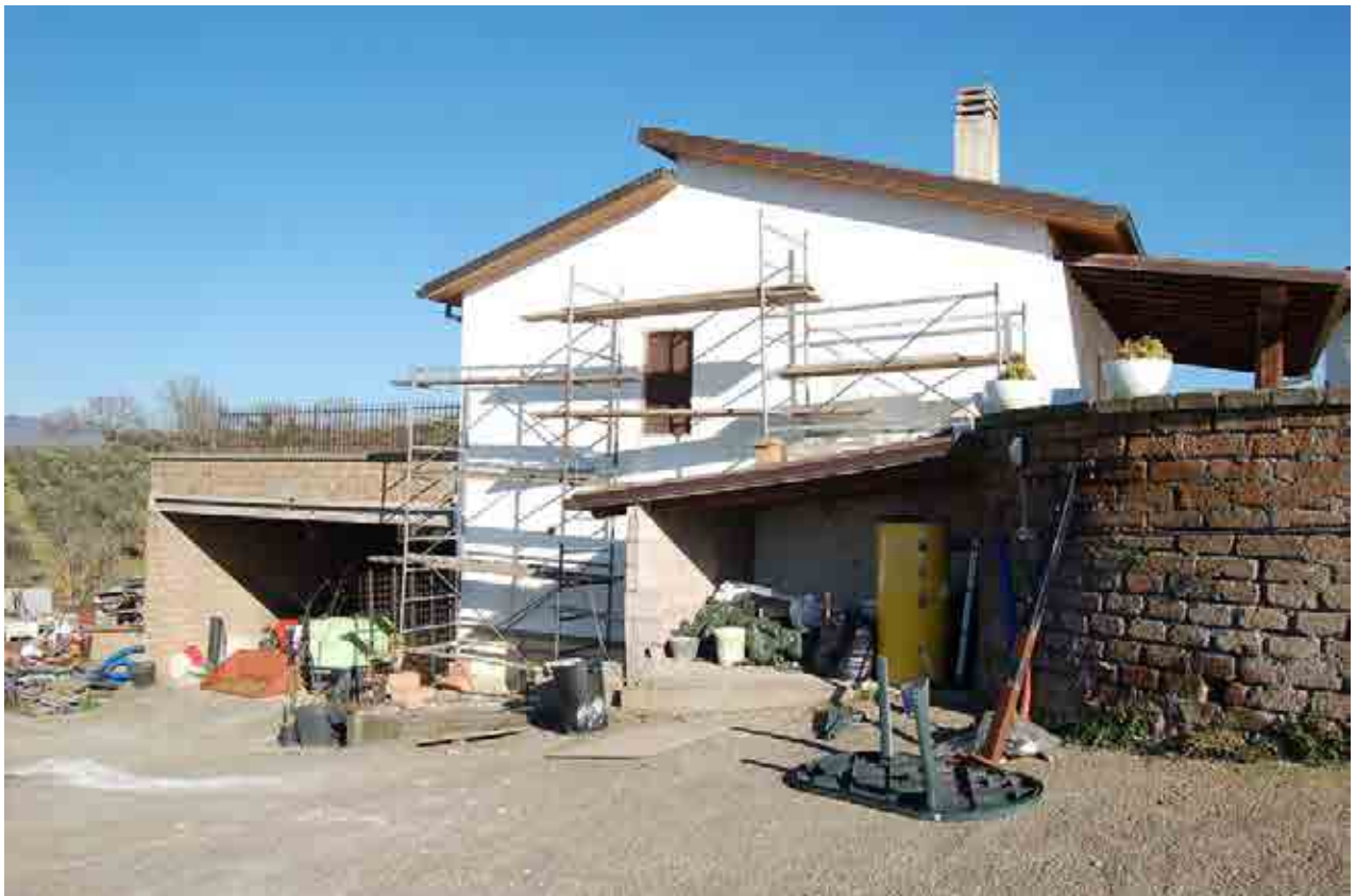
Foto 70 - Fabbricato isolato fronte ovest