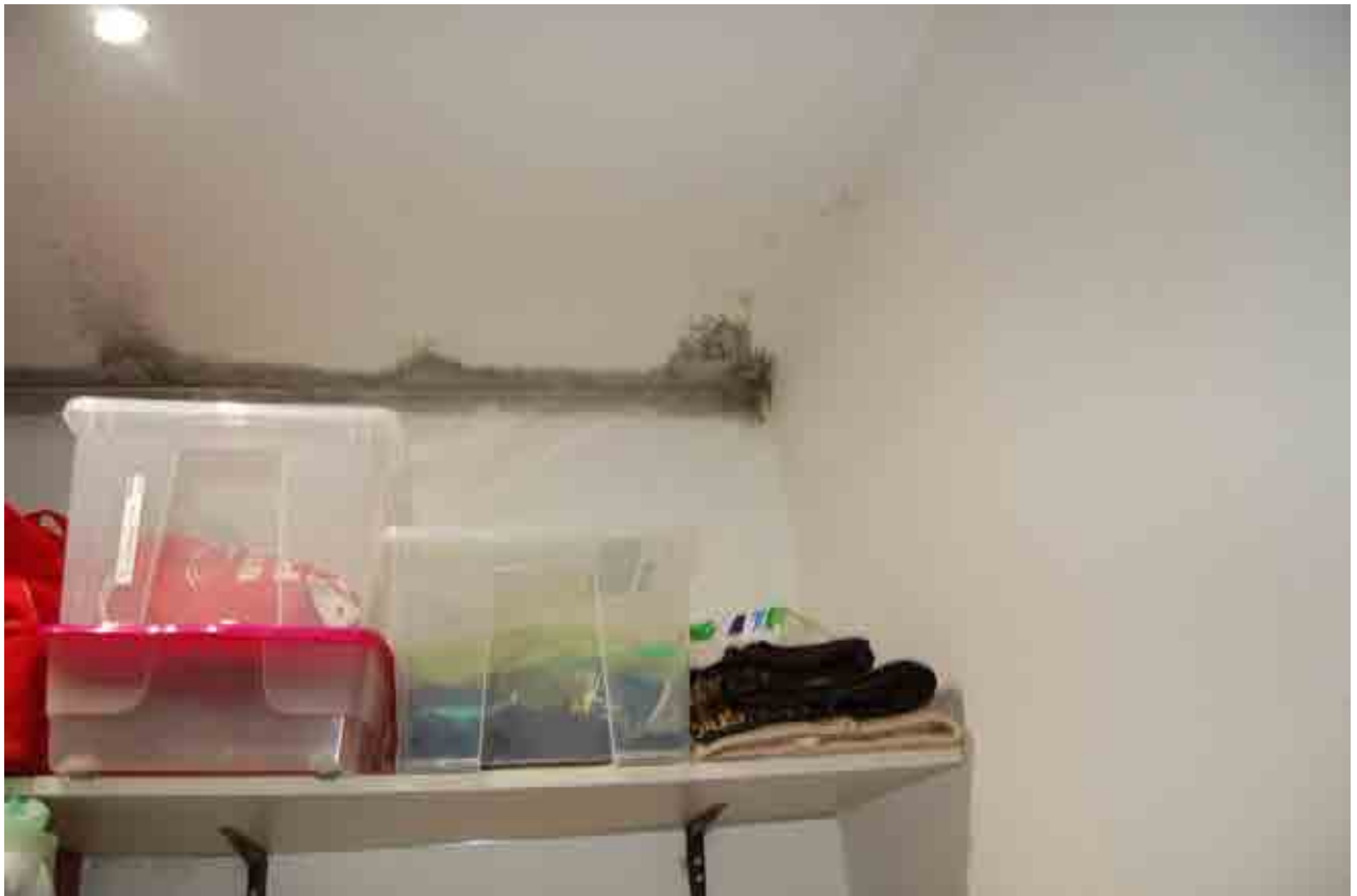
Foto 84 - Dettaglio soffitto lavanderia