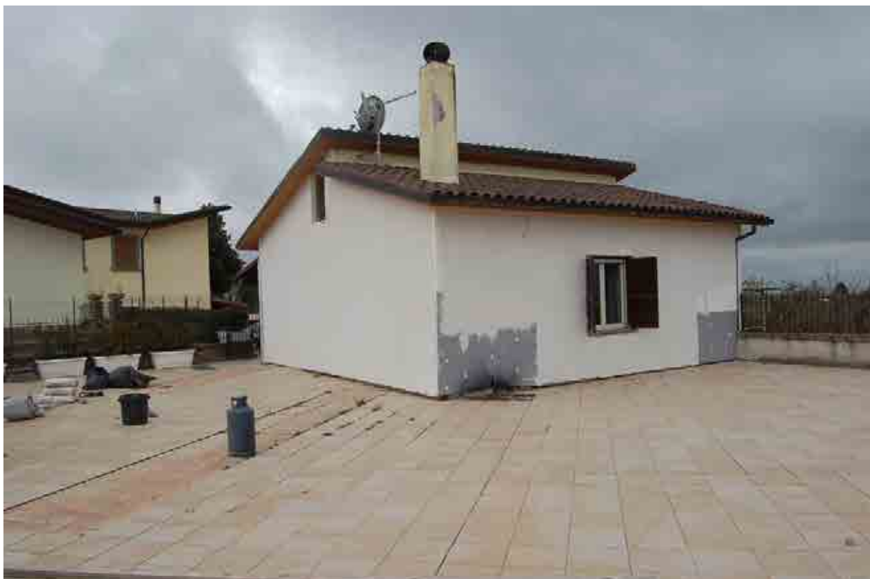
Foto 73 - Fabbricato isolato fronte nord-est