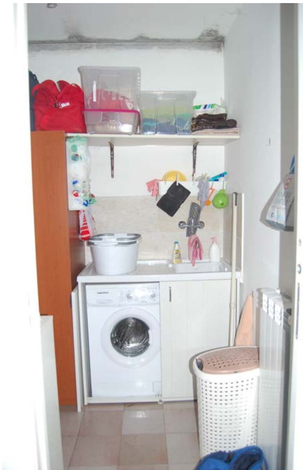
Foto 82 - Lavanderia