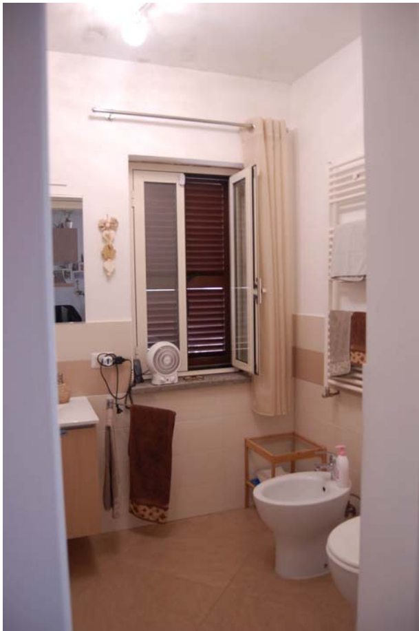
Foto 81 - Bagno