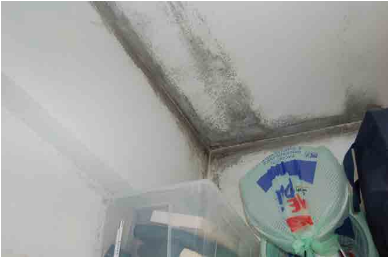
Foto 83 - Dettaglio soffitto lavanderia