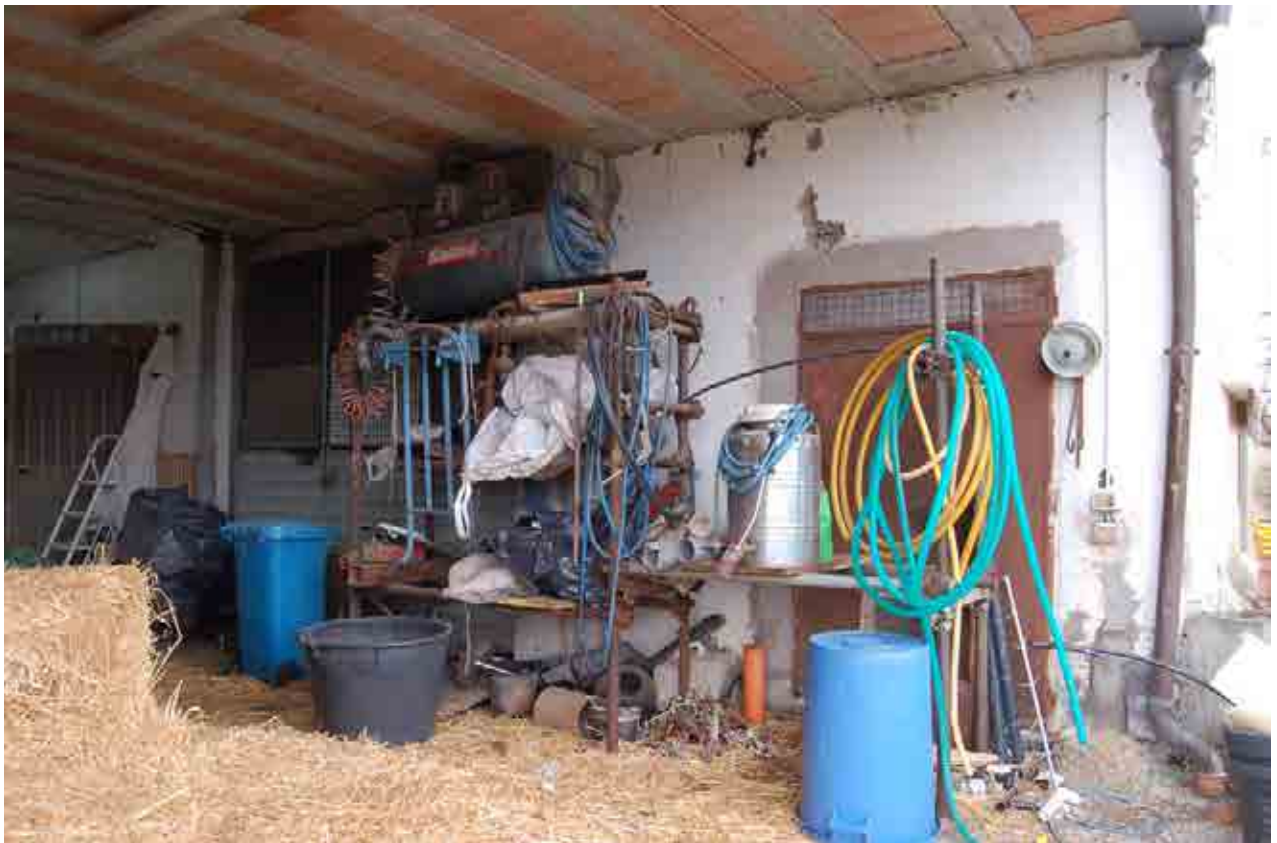
Foto 88 - Ingresso magazzino attrezzi